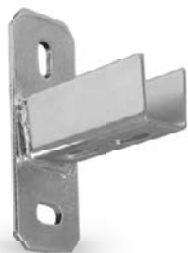
Strut Voet / Embase