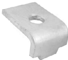
Strut klemplaat enkel / pince de fixation