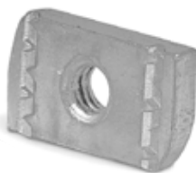
Schuifmoer / Ecrou-rail