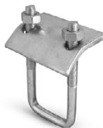
Balkklem / Collier de serrage